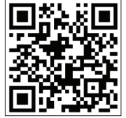
Union Health Center

PCPs know your health history and are best for routine medical care and issues that aren't urgent. • $0 for visits at the Union Health Center • $0 locations throughout the five boroughs at AdvantageCare Physician Group and Montefiore Medical Group • Use Horizon's doctor finder to locate network providers who offer $0 preventive (annual) care and $10 PCP visits