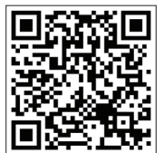
Summit Health/ City MD

* Clase II: los beneficios de los servicios de las instalaciones están limitados a $900 por visita