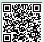
Horizon's doctor finder